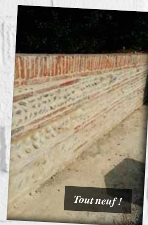
Tout neuf !