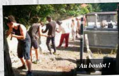
Au boulot !