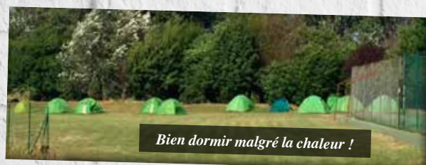
Bien dormir malgré la chaleur !