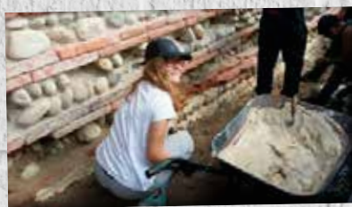
Parité au travail